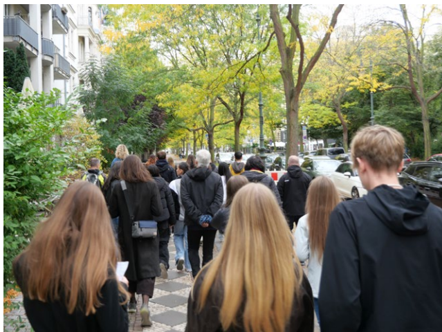
Teilnehmerinnen und Teilnehmer des Stolperstein-Spaziergangs

Die „Stolpersteine“ des Künstlers Gunter Demnig sind kleine Messingplatten, die im Straßenpflaster vor Häusern verlegt werden, in denen Menschen wohnen, die dem Nationalsozialismus zum Opfer gefallen sind. Über 100.000 dieser kleinen Denkmäler sind inzwischen in zahlreichen deutschen und europäischen Städten zu finden.