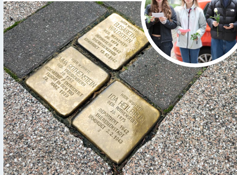
Vor dem Haus, Geißlerstraße 3

Text: Emil (14), Marie-Sofie (14), Svea (15)