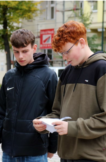
In der Harnackstraße