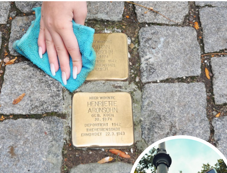
Vor dem Haus, Hegelstraße 26