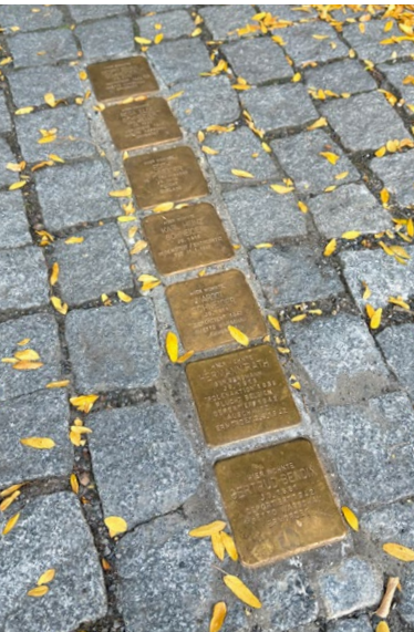
Vor dem Haus, Hegelstraße 37